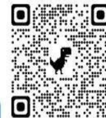
Регистрация на конференцию